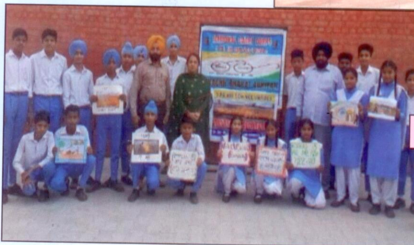
ਪਰਾਲੀ ਨਾ ਸਾੜਨ ਸਬੰਧੀ ਜਾਗਰੂਕਤਾ ਸੈਮੀਨਾਰ