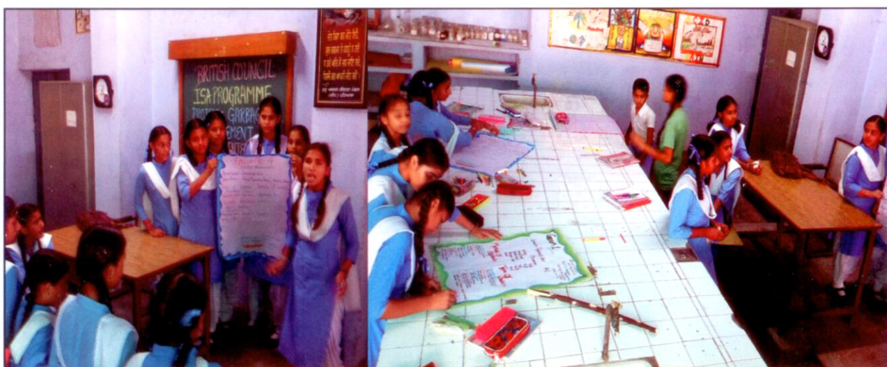
Presentations on 'Garbage Management'