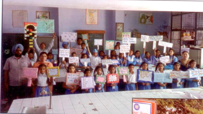
ਵਿਦਿਆਰਥੀ ਸੜਕ ਨਿਯਮ ਅਤੇ ਸੜਕ ਸੁਰੱਖਿਆ ਲਈ ਜਾਗਰੂਕਤਾ ਕਰਦੇ ਹੋਏ