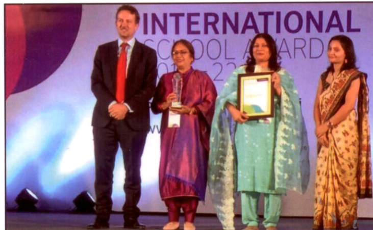
Principal and Co-ordinator receiving The International School Award in New Delhi