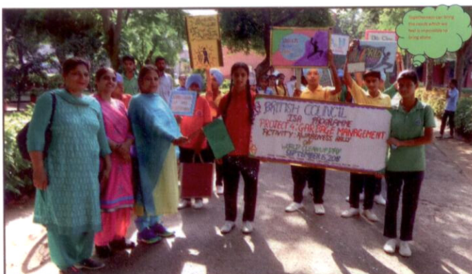
'WORLD CLEAN UP DAY' Principal Flagging off the Awareness Rally