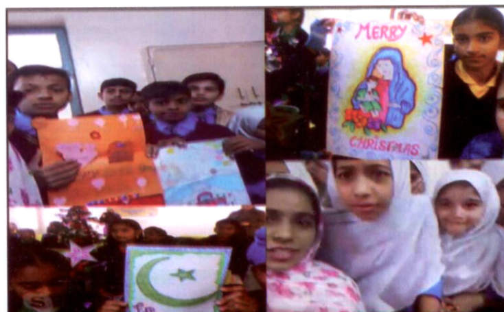
Skype session with City District Boys Elementary School Ajodhia Pur, Lahore (Pakistan)