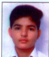
Isha XII-Arts (91.11%)