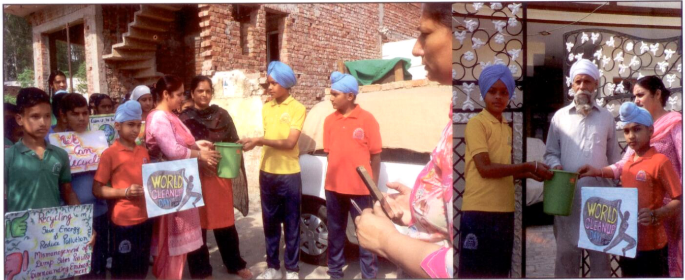
Distribution of dustbins in the neighbourhood to create awareness regarding CLEANLINESS DRIVE among the masses