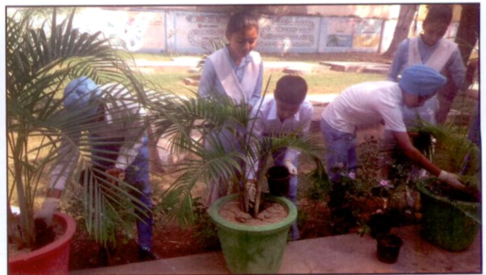
Students Composting Flowerpots