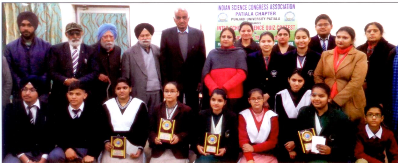
Inter School Science Quiz on Science and Technology