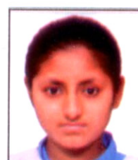
Nancy XII-Arts (90%)