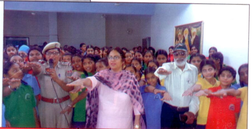
ਸੜਕ ਸੁਰੱਖਿਆ, ਨਸ਼ਿਆਂ, ਅਪਰਾਧਾਂ ਅਤੇ ਫਸਟ ਏਡ ਸਬੰਧੀ ਸੈਮੀਨਾਰ ਦੌਰਾਨ ਸਹੁੰ ਚੁੱਕਦੇ ਹੋਏ