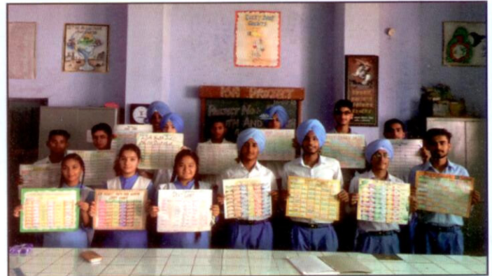
DIET CHARTS displayed by the students